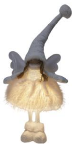
Svítilna anděl, 449 Kč

Novinkou je trend umísťování světel na netradiční místa – například kolem vstupních dveří, na zábradlí nebo zavěšením nad jídelní stůl. Tento jemný a intimní přístup k osvětlení dodává vánočním svátkům poklidnou a stylovou atmosféru. V sortimentu ASKO – NÁBYTEK naleznou zákazníci i řetězy s časovači, které zajistí rovnoměrné a bezpečné osvětlení.