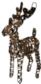
Svítilna sob, 389 Kč