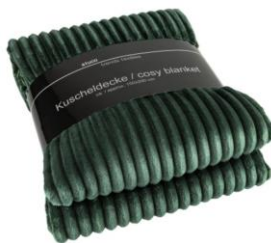
Deka 150 x 200 cm, 599 Kč