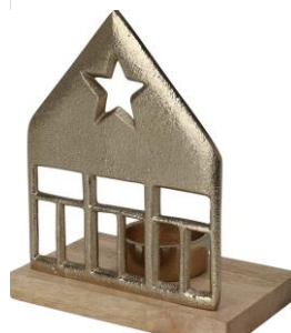
Svítilna, 129 Kč