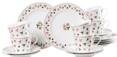
Servis Perníček, 1 699 Kč