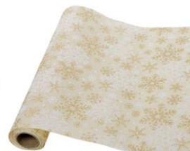
Prostírání vložky, 149 Kč