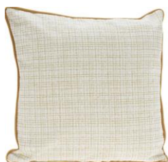
Dekorační polštář, 299 Kč

Doplňky jako tkané deky, ubrusy s jemnými vánočními vzory nebo polštáře v přírodních barvách dodají interiéru teplo a pocit domácího komfortu. „Pro sváteční tabuli doporučuji ubrusy a prostírání s jednoduchým potiskem, které umocní přirozenost výzdoby. Zaměřte se na výběr několika základních barev a materiálů, které mezi sebou jednoduše nakombinujete,“ radí Andrea Štěpánová z ASKO – NÁBYTEK a dodává: „Jednoduché přírodní textilie budou harmonicky ladit s dřevěnými ozdobami a teplým světlem, což vytvoří skutečně stylovou atmosféru.“