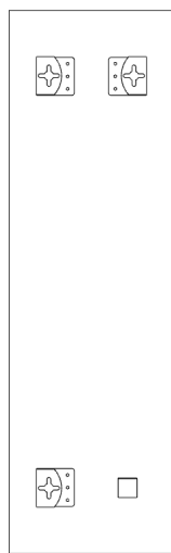
SK Zadný pohľad CZ Zadní pohled EN Back view DE Rückansicht HU Hátlónézet RO Vedere din spate